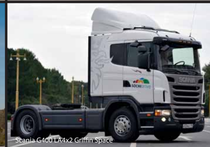
Scania G400 LA4x2 Griffin Space