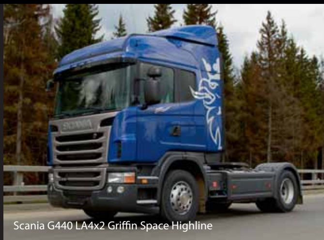
Scania G440 LA4x2 Griffin Space Highline

Тяжелый седельный тягач Scania P440 CA6X4HSZ Griffin Camel