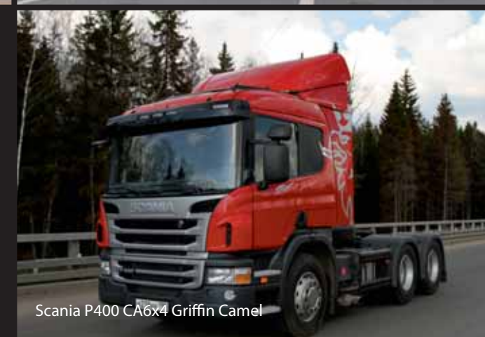
Scania P400 CA6x4 Griffin Camel