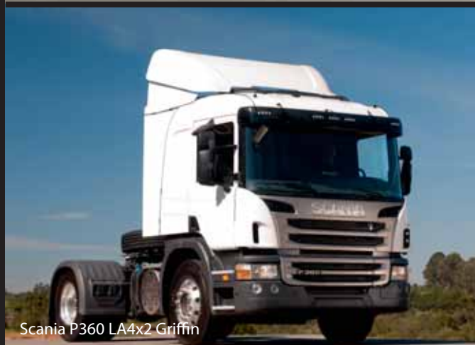
Scania P360 LA4x2 Griffin