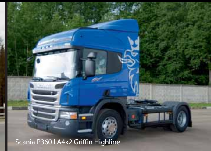
Scania P360 LA4x2 Griffin Highline